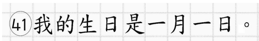
Рис.14. Образец написания иероглифических знаков

Односторонний бланк ответов № 2 (лист 1 и лист 2) предназначен для записи ответов на задания с развернутым ответом по китайскому языку (строго в соответствии с требованиями инструкции к КИМ и к отдельным заданиям КИМ). Каждый иероглифический знак и каждый знак препинания следует писать внутри отдельной клетки области ответов бланка ответов №2 (дополнительного бланка ответов №2) (рис. 14).